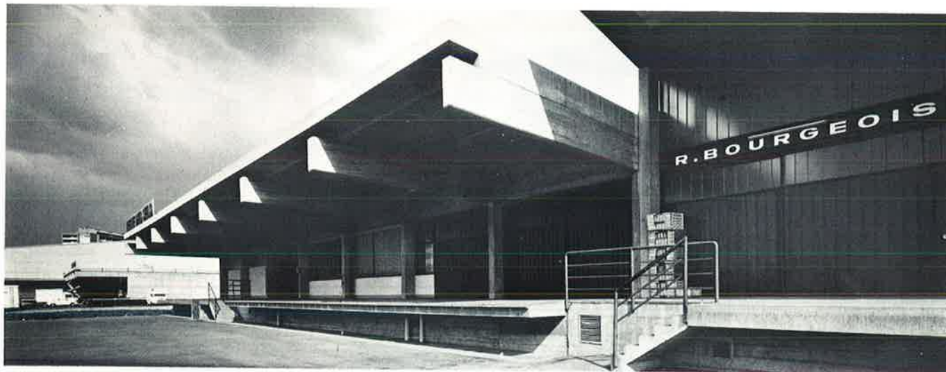
Régie des Sels

Zone industrielle de la Praille — Genève